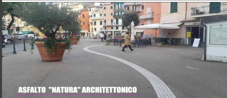
ASFALTO "NATURA" ARCHITETTONICO