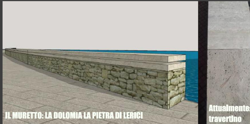
IL MURETTO: LA DOLOMIA LA PIETRA DI LERICI