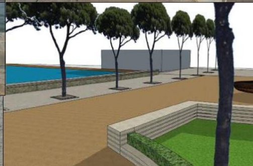
SEDUTE E BORDURE IN DOLOMIA